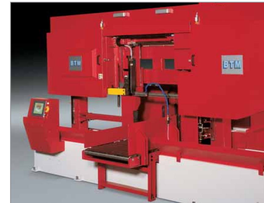
mod. 720 CNC 500