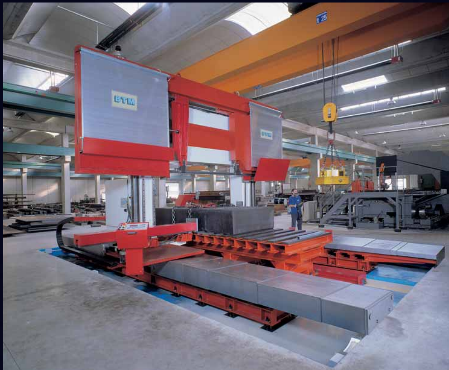
mod. 1600 CNC mod. 2000 CNC Gruppo di taglio traslabile: corsa 6000 mm. Sliding cutting unit: sliding length up to 6000 mm.